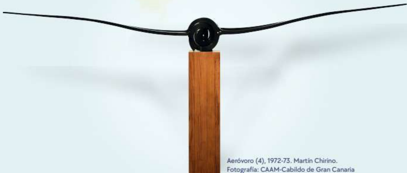
Aeróvoro (4), 1972-73. Martín Chirino.